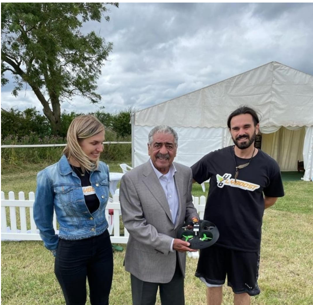
Con Megren Bin Abdulaziz