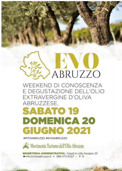
locandina evo abruzzo generale