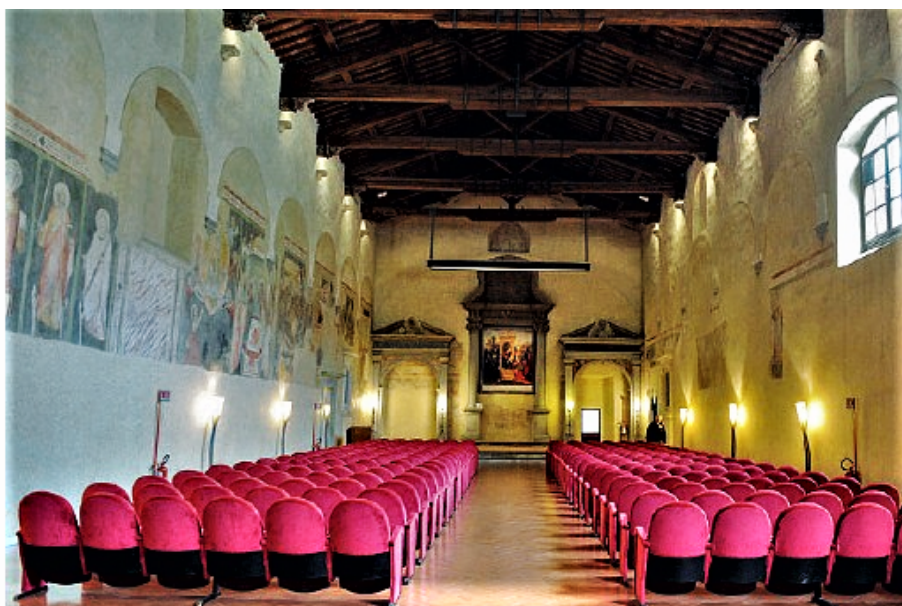
Firenze, San Jacopo a Ripoli

La premiazione domenica 20 giugno, ore 16, nel suggestivo contesto di San Jacopo a Ripoli