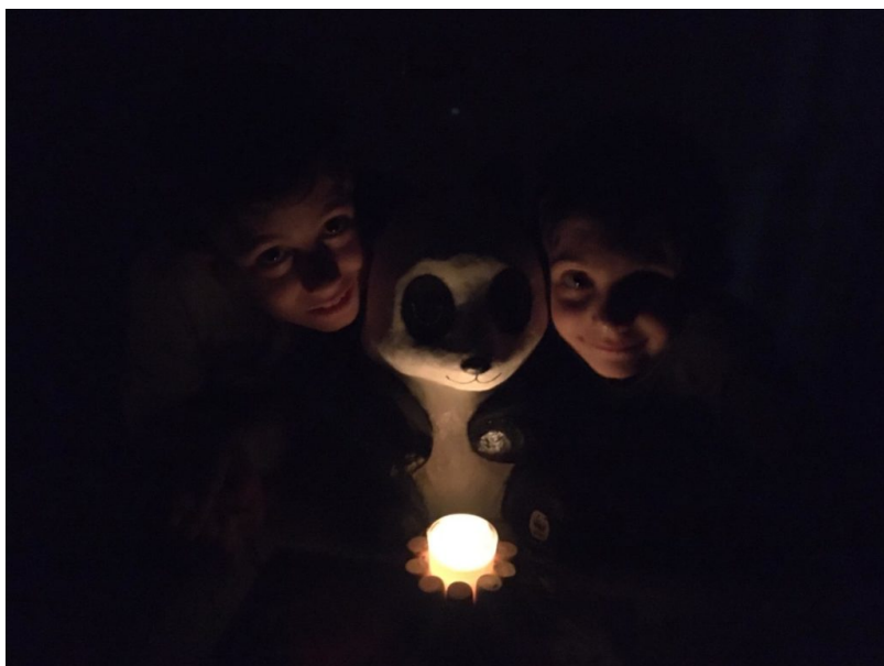
Ora della Terra WWF