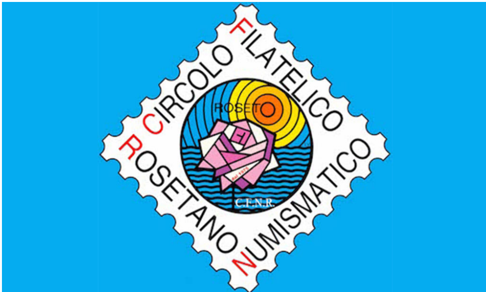
Logo Circolo Filatelico Numismatico Rosetano

“Il Circolo Filatelico Numismatico Rosetano, di Roseto degli Abruzzi (Teramo) informa che a causa delle misure restrittive per contenere l'emergenza epidemiologica da “coronavirus” COVID-2019, sospende le sue attività e la sede resterà chiusa ai soci e ai cittadini fino a domenica 5 aprile, salvo eventuali comunicazioni.. Tutte le emissioni di francobolli, monete, bollettini, FDC, tessere, folder e prodotti filatelici saranno regolarmente acquistati sia prodotti Poste Italiane, Repubblica di San Marino, Città del Vaticano, Smom e sia di altri stati europei e mondiali collezionati dai soci. I prodotti potranno essere ritirati dopo il 5 aprile”. Per informazioni o contatti telefono 3203758412.