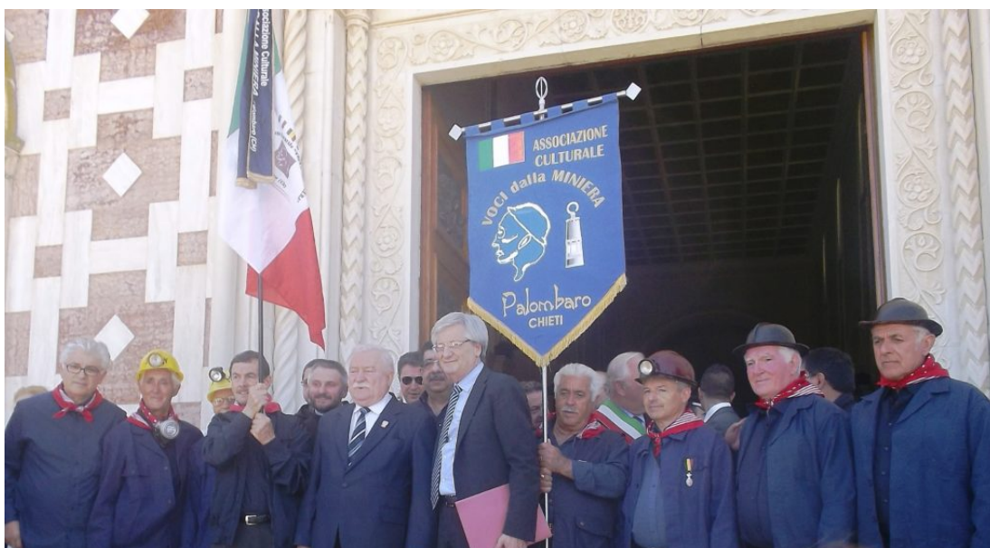
Lech Walesa con i minatori a Manoppello.