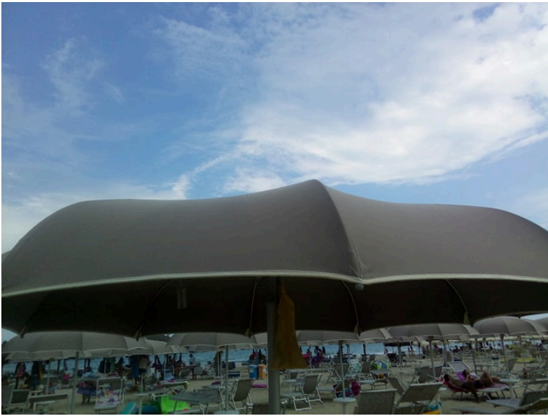
Mare Spiaggia Giulianova Lido

Chieti, 11 agosto. L'Abruzzo è al 19esimo posto in Italia per arrivi e presenze di turisti: nel 2017 i primi (cioè il numero di clienti ospitati negli esercizi ricettivi) sono stati 1.548.653, mentre le seconde (cioè il numero delle notti trascorse) sono state 6.193.473. Il 14% dei turisti è straniero e la permanenza media è di quattro giorni. Il tasso di turisticità dell'Abruzzo è pari al 4,7 (6,9 in Italia), dato che colloca la regione al 13esimo posto in Italia. E' quanto emerge da un'analisi del centro studi di Confartigianato Chieti L'Aquila.