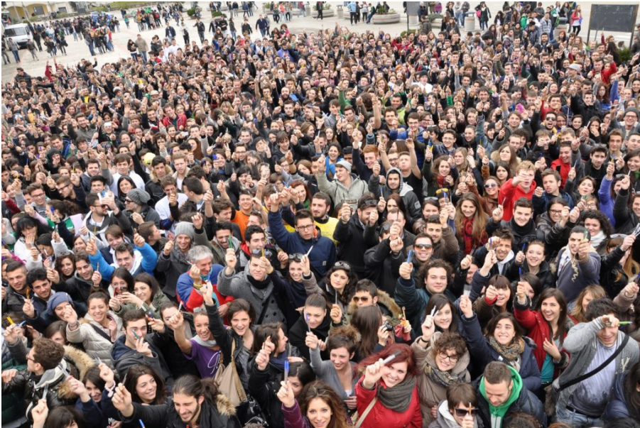
Giovani al Santuario San Gabriele (TE), 1

Cinquecento giovani arriveranno, alle ore 16.30, dalle diocesi abruzzesi, guidati dai loro vescovi; quindi, alle ore 18.30, parteciperanno nel nuovo santuario alla messa presieduta da monsignor Bruno Forte, arcivescovo di Chieti-Vasto e concelebrata dagli altri vescovi abruzzesi.