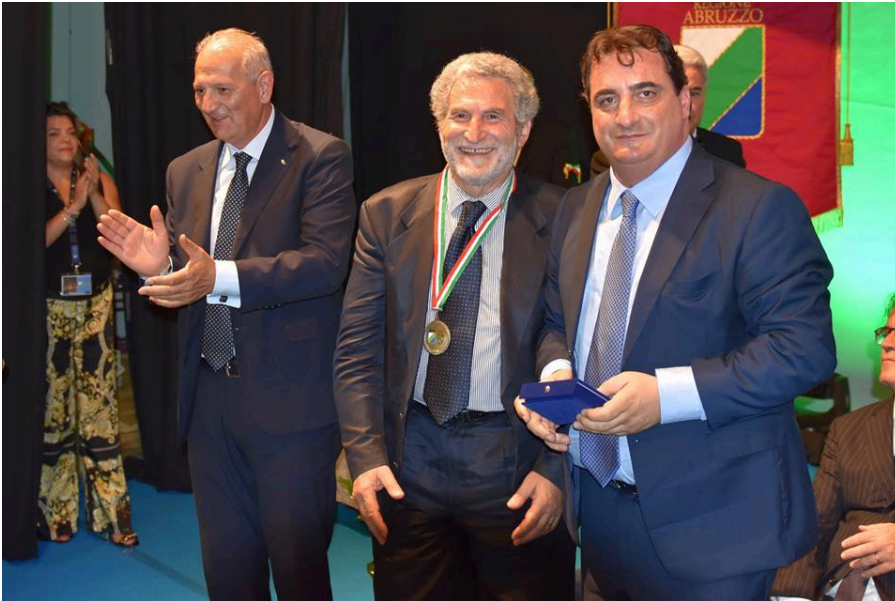
Goffredo Palmerini, storico e giornalista aquilano