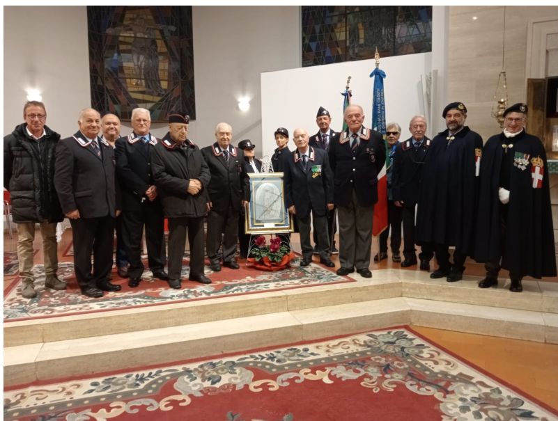
ANC CC il gruppo dei partecipanti