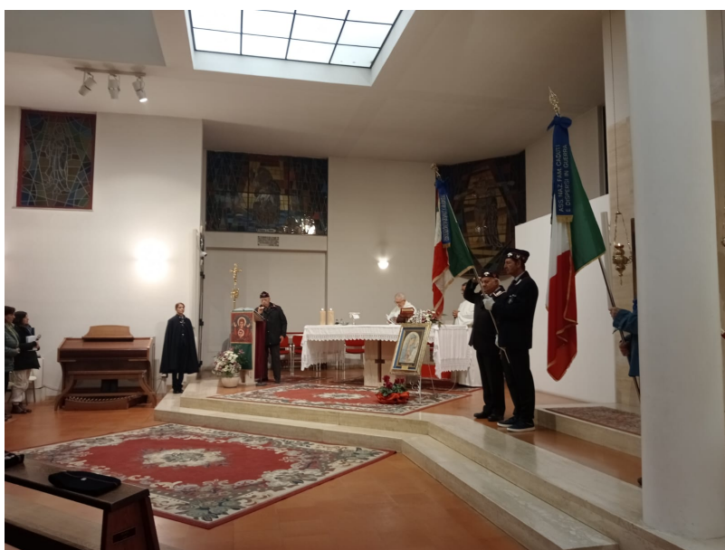
ANC CC un momento della Santa Messa