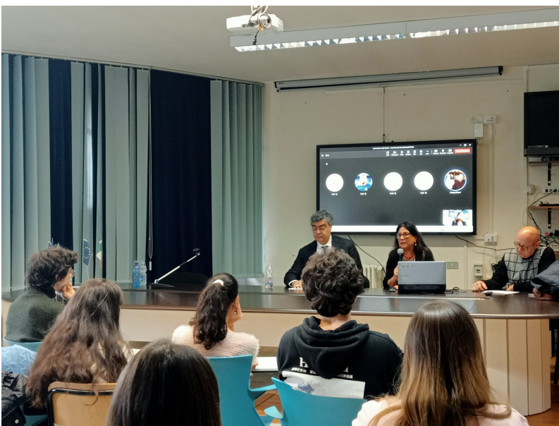
Le studentesse e gli studenti delle classi quinte del Liceo Statale Curie di Giulianova il 23 novembre hanno partecipato ad una lezione particolare: l'on. Emanuele Fiano ha tenuto una conferenza sulla storia dell'Olocausto presentando anche il suo