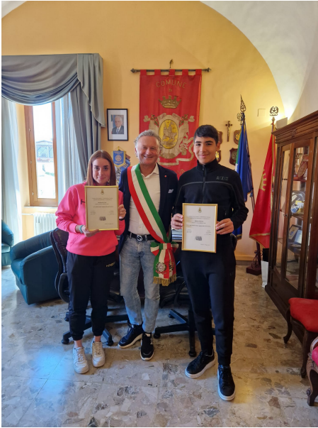
Foto premiazione ragazzi beach tennis