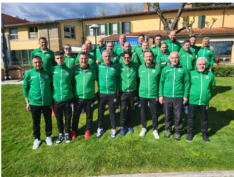
Si è chiusa oggi la tre giorni di formazione con la consegna degli attestati e il saluto del neo presidente Aia, Carlo Pacifici.