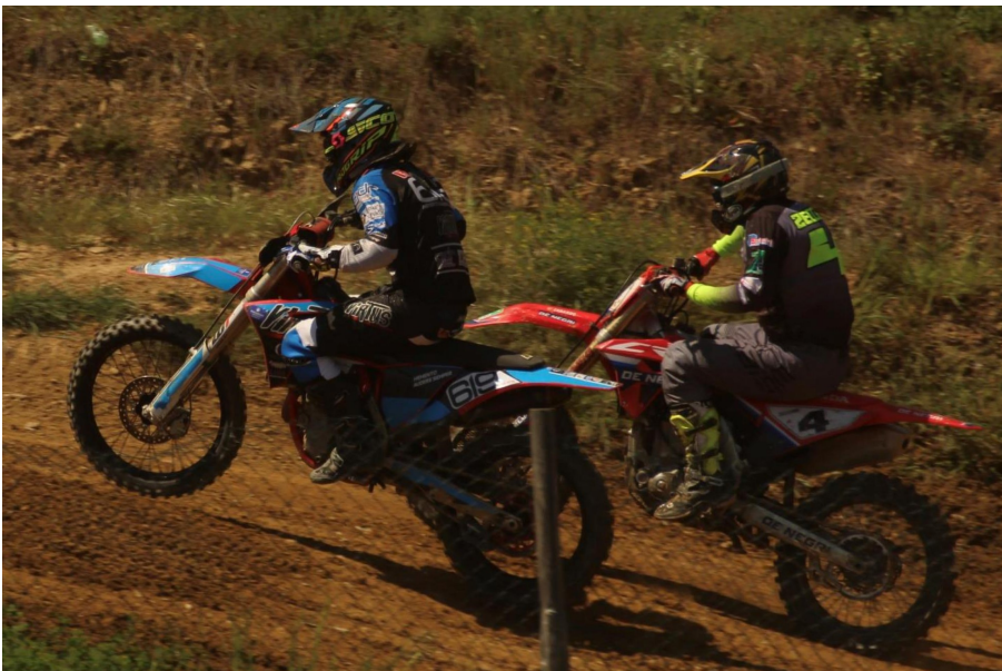
Rasetta del Virtus Racing Team si aggiudica Gara 1 e Gara 2