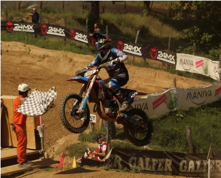
Rasetta del Virtus Racing Team si aggiudica Gara 1 e Gara 2