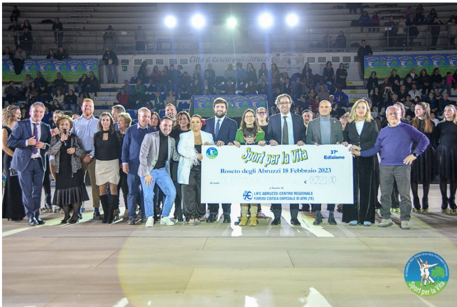
L'assegno di Sport per la Vita