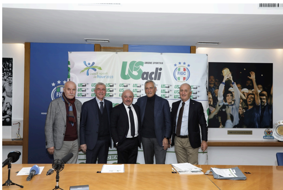
Gravina: "Con Spalletti valutiamo progetto nelle scuole"