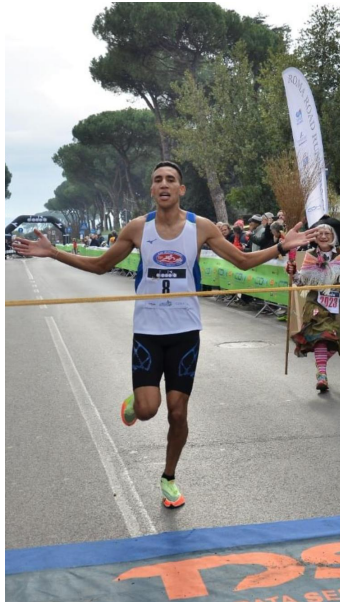
vittoria zerrad _roma 29° ed. befana 2023