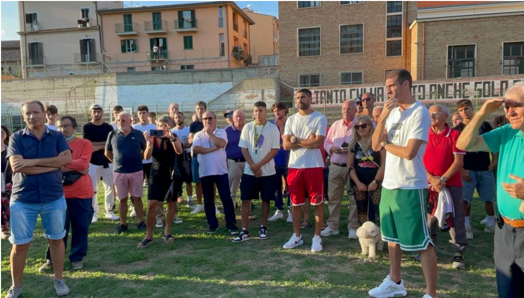
Teramo Calcio foto archivio