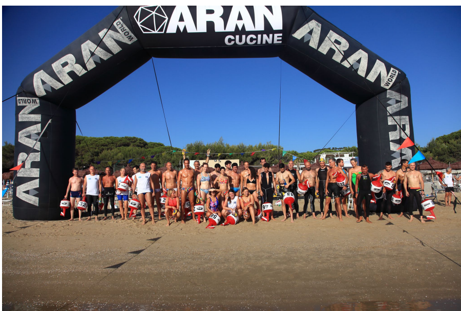
Pineto (TE) 4 Luglio 2022- Un successo annunciato quello del “Trofeo di Nuoto Città di Pineto” che ha avuto luogo sabato 2 Luglio a Pineto nelle acque antistanti il Lido La Florida. Un appuntamento che si perpetua ormai da 15 anni, organizzato dal gruppo Spatangus con il patrocinio dal Comune di Pineto, dell’Area Marina Protetta “Torre del Cerrano”, dell’Associazione