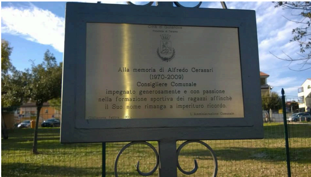
La targa che da il nome al parco comunale