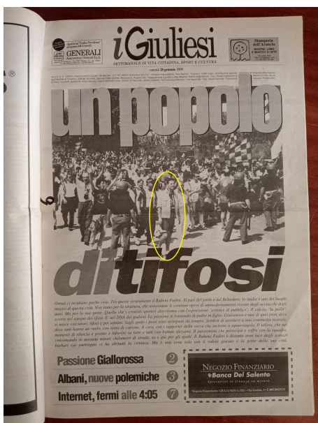
La prima pagine del settimanale "I Giuliesi"