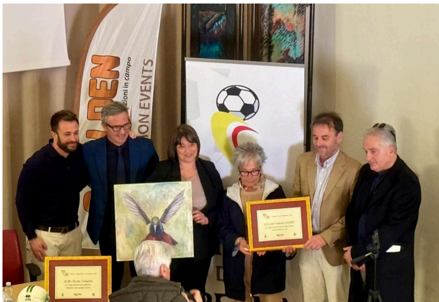
Torneo Emilio Della Penna 2024