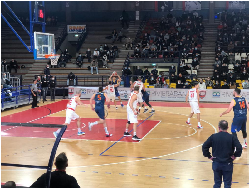
Giulianova Basket