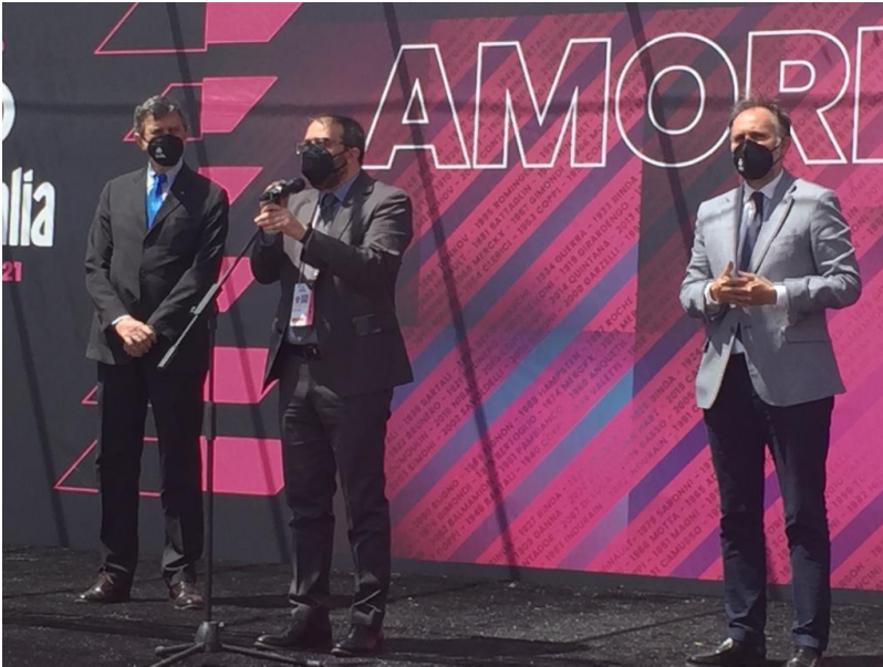
L'Aquila, Il Giro d'Italia