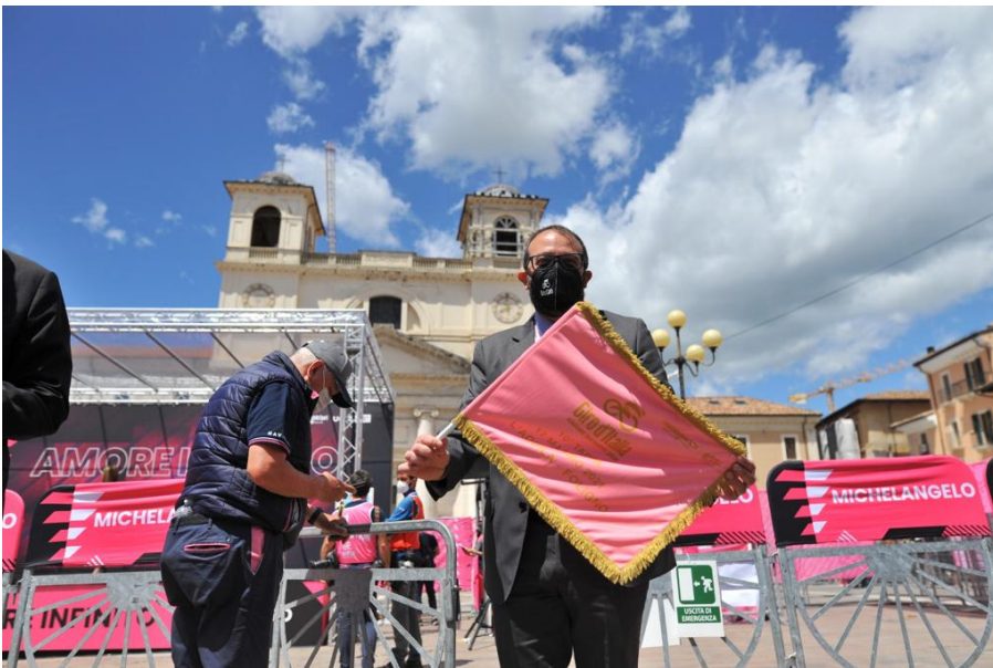
L'Aquila, Il Giro d'Italia