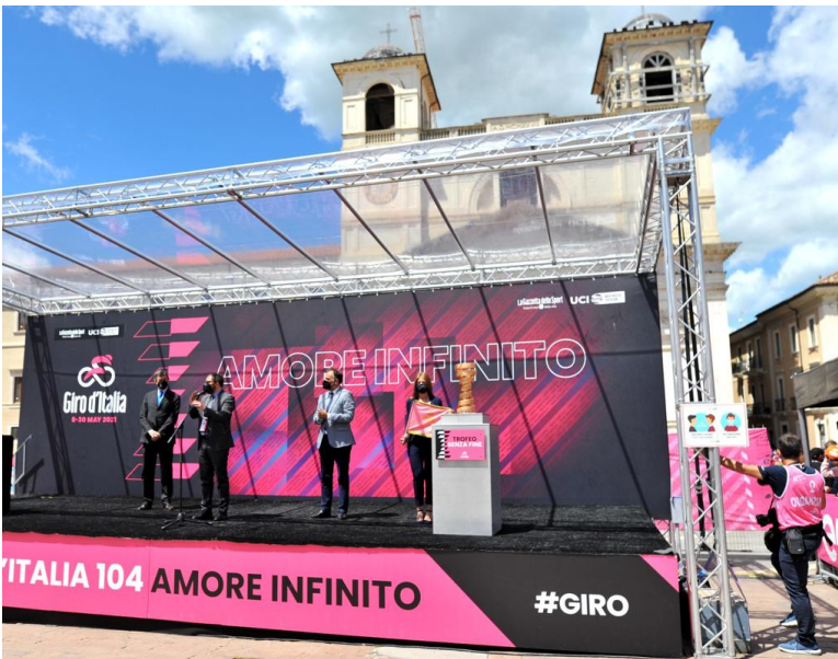
L'Aquila, Il Giro d'Italia