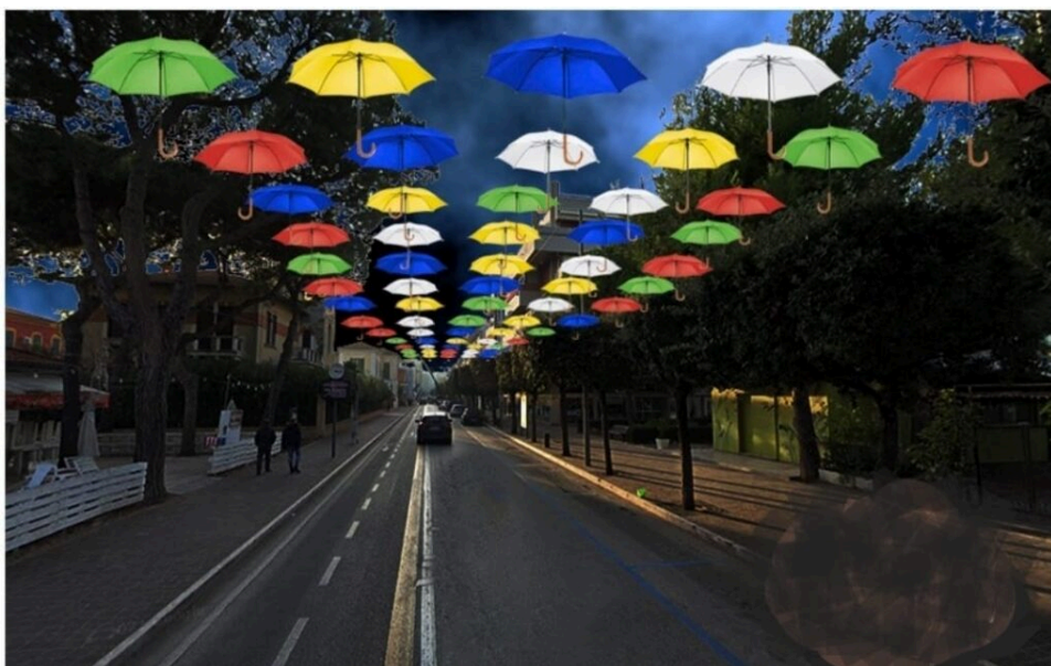
Piazza Dalmazia Giulianova