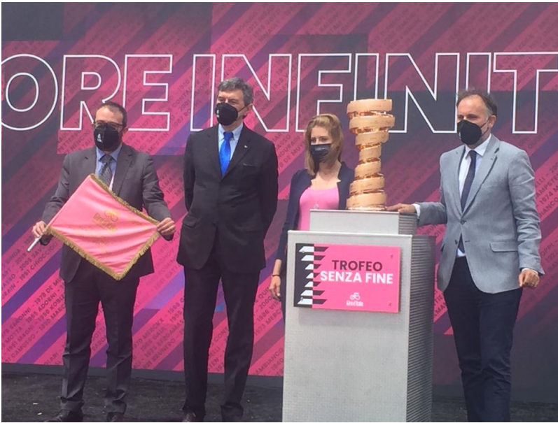
L'Aquila, Il Giro d'Italia