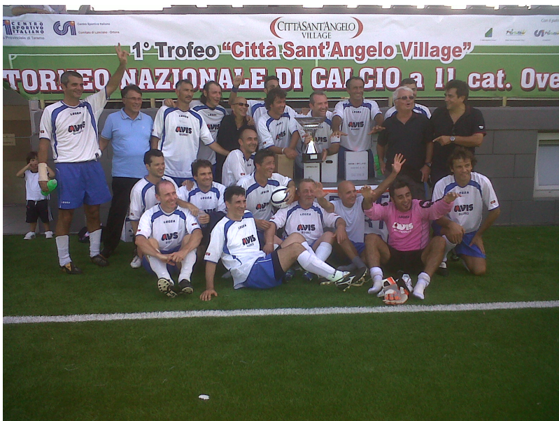
Foto Budrio Squadra vincitrice Over 35

Il titolo è andato all’Avis Budrio Bologna, al termine dell’avvincente incontro con l’Alba Tortoreto conclusosi sul 2 a 1. I felsinei si posizionano, così, sul tetto più alto d’Italia della categoria, andando ad occupare il primo posto nell’albo d’oro della manifestazione. Nella coppa CSI l’Am. Santa Liberata prevale sull’Amatori Agnone per 3 a 2.