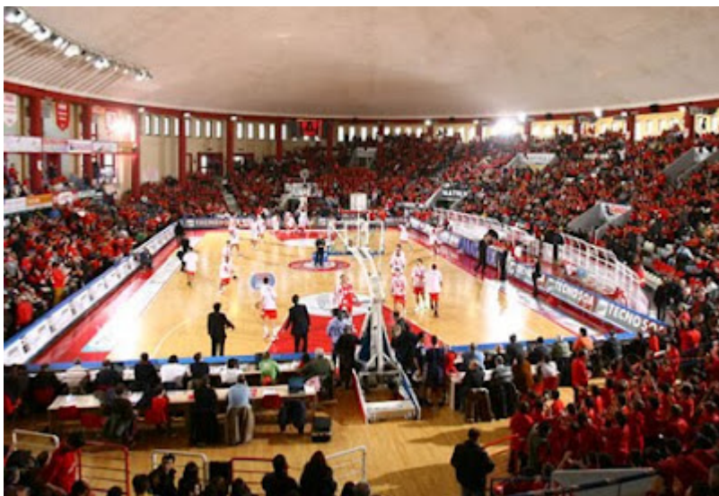
Drake Diener ancora biancorosso