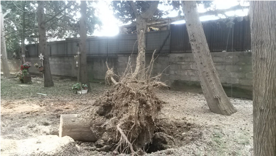
Cipressi del Cimitero