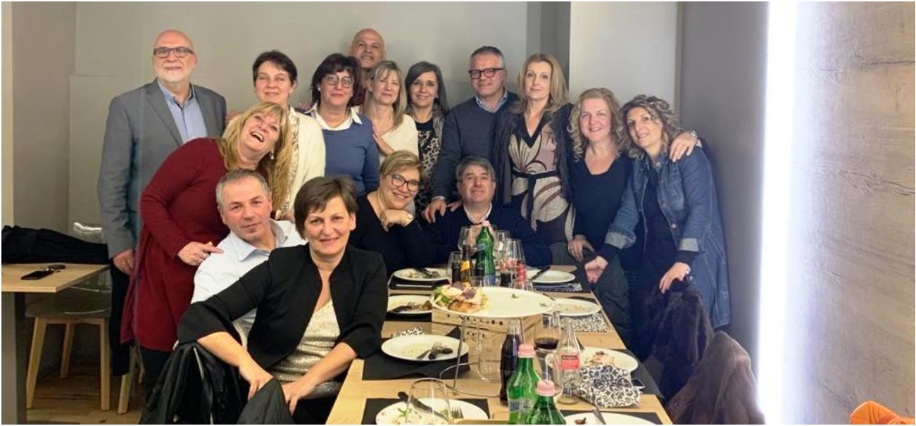
Montorio al Vomano