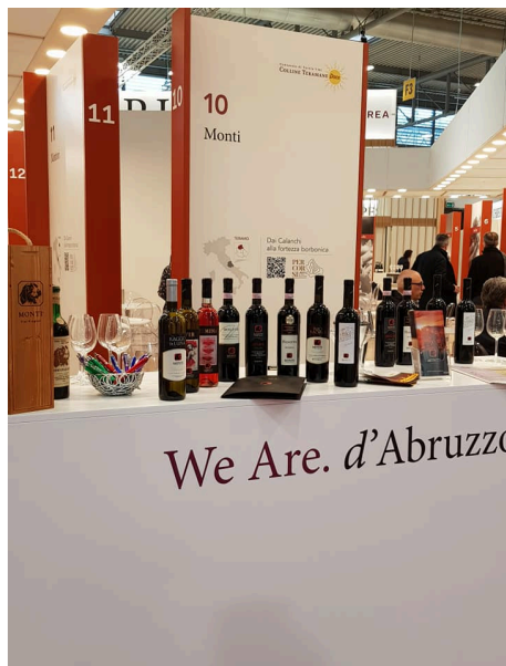
Monti al Vinitaly 2019

Il Montepulciano d'Abruzzo Colline Teramane Docg Riserva Pignotto 2010 dell'Azienda Agricola Monti di Controguerra vince il Premio delle 5StarWines, il concorso enologico internazionale di Vinitaly, nella categoria Vino Rosso.