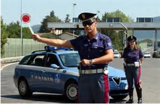
POLIZIA foto archivio

Il servizio aveva la finalità di repressione dello sfruttamento della prostituzione, ricerca di immigrati clandestini, prevenzione dei reati predatori.