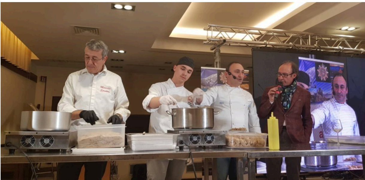
Un momento dello show cooking

Teramo, 19 dicembre 2018 - Gli Stati Generali del Turismo che si sono svolti nella città di Teramo dal 17 al 18 dicembre all'interno della manifestazione regionale dal titolo #destinazioneabruzzo Step 2, rappresentano il punto di svolta delle politiche di programmazione e di promozione del territorio regionale abruzzese.