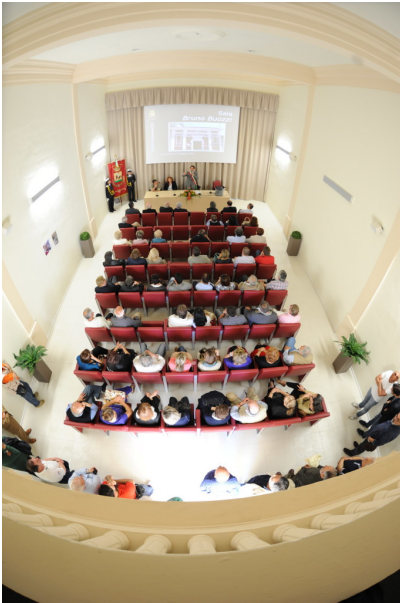
Interno Sala Buozi