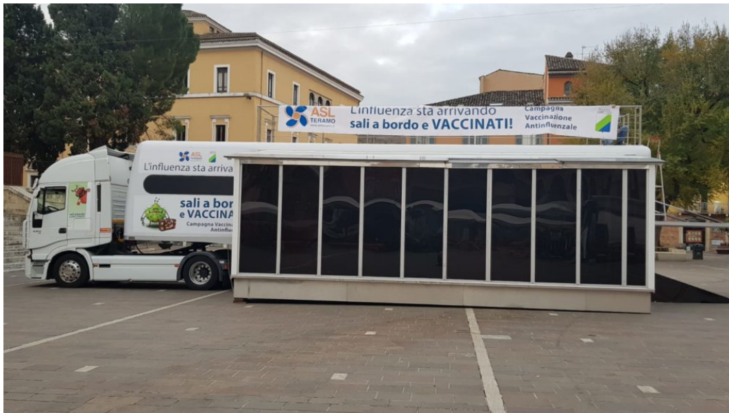
4 jumbo truck ASL

la ASL di Teramo stamattina ha invitato tutti gli operatori della comunicazione alla Conferenza Stampa che si è tenuta a Teramo alle ore 11:00 in Piazza Martiri della Libertà , in occasione della prima giornata della nuova iniziativa per promuovere la Vaccinazione anti influenzale .