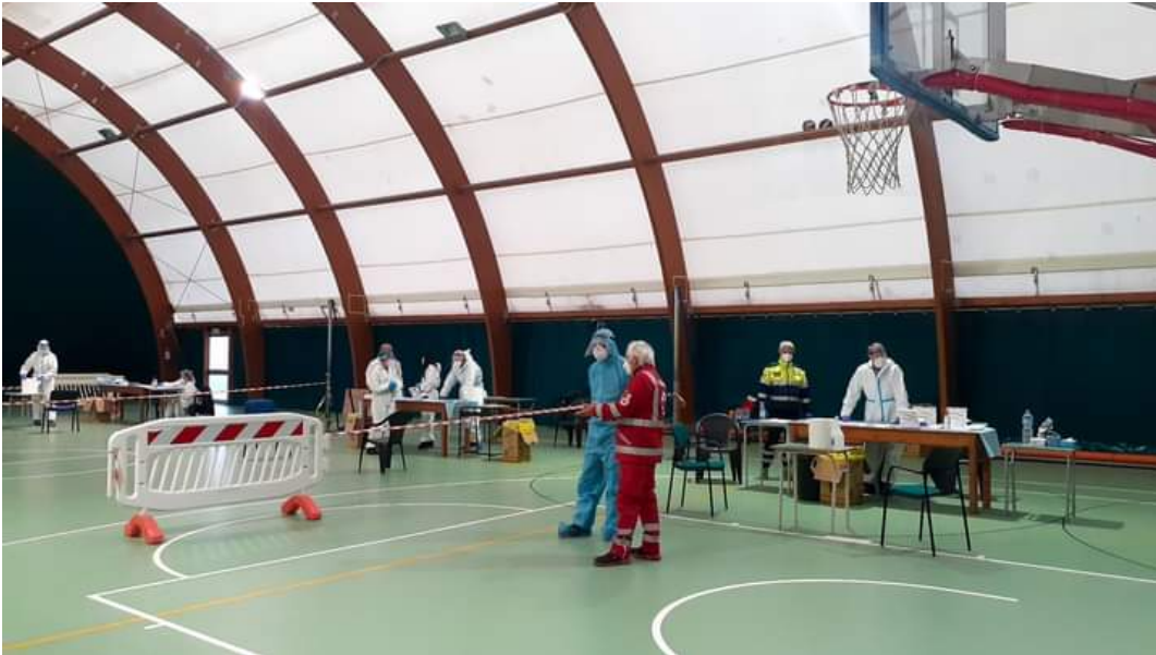
OPERATORI AntiCovid-19

Le tante forme di solidarietà fatte nell'emergenza COVID, è una grande ricchezza di umanità, risorsa che deve essere apprezzata, ed avere una continuità con le sue importanti e belle qualità.