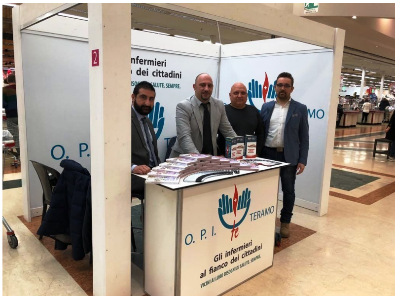
Stand OPI centro commerciale Val Vibrata

Nello scorso fine settimana l' Ordine delle Professioni Infermieristiche di Teramo (ex Collegio Ipasvi) è stato impegnato nel tour "INSALUTE" , campagna di screening gratuiti che si è tenuta nei principali centri commerciali della regione. Gli infermieri teramani sono stati presenti sia nel weekend del 10 e 11 marzo al centro commerciale Val Vibrata, che in quello del 17 e 18 marzo al Gran Sasso di Piano d'Accio. Negli stand allestiti per l'occasione sono stati proposti screening gratuiti al pubblico insieme ad altre specialità mediche e sanitarie. L'ennesima dimostrazione di vicinanza della professione infermieristica alle esigenze di salute della popolazione.