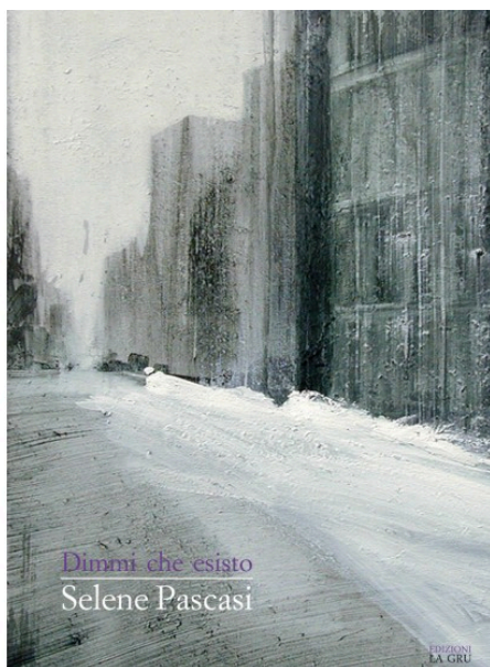
Dimmi che esisto