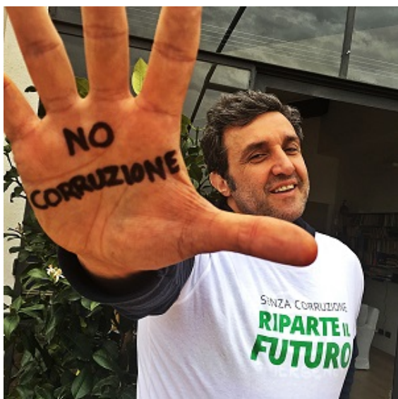
insinna no corruzione