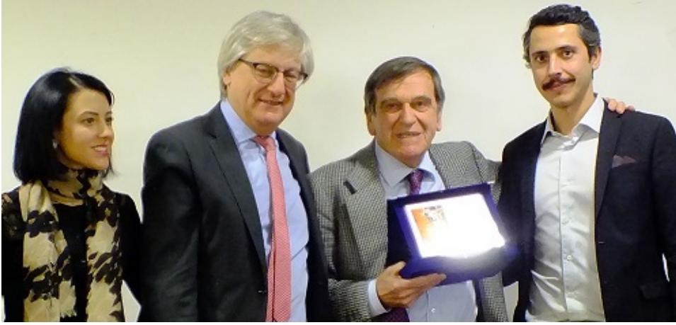
Premio Zimei 2017