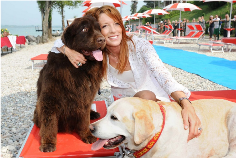
l'ex ministro del turismo michela vittoria brambilla_inaugurazione baubeach_peschiera del garda

primavera: politiche, regionali, amministrative. Questa mattina, in tutte le provincie italiane, i dirigenti locali del Movimento fondato dall'on. Michela Vittoria Brambilla hanno presentato ai media se stessi, i coordinamenti, il programma nazionale "Agenda per un'Italia migliore" e quello specifico per il loro territorio.