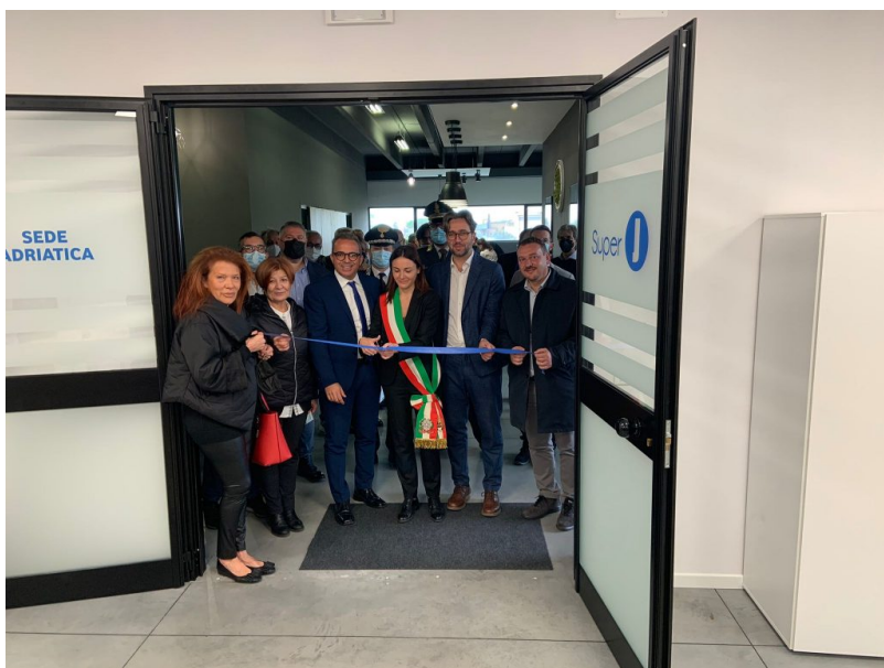
Super J Giulianova