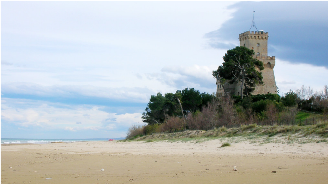
Torre del Cerrano Pineto Silvi

Viste le recenti polemiche di stampa per cui l'Area Marina Torre del Cerrano - suo malgrado - è stata teatro di un gesto quantomeno poco educativo, ci piace ricordare che lo scorso anno, proprio l'AMP ha aderito all'iniziativa "Ma il mare vale una cicca?" promossa da Marevivo. Centinaia di volontari sono stati impegnati nella pulizia di circa 50 spiagge, lungo gli 8mila km di coste italiane. Sono stati distribuiti 650 posacenere da esterno , detti "Cenerino", in 350 stabilimenti balneari in Italia e centri visita delle Aree Marine Protette, insieme a poster informativi sui tempi di smaltimento di diverse tipologie di rifiuti, tra cui i mozziconi.