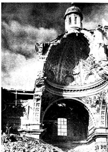
Basilica di San Tommaso ad Ortona distrutta dai bombardamenti degli alleati.

Bellante. Domenica 26 Settembre, in Piazza Arengo a Bellante paese, a partire dalle ore 10.00, l'Associazione culturale Nuove Sintesi terrà la Commemorazione "ONORE D'ITALIA" in Ricordo dei civili caduti sotto i bombardamenti degli alleati e dei militi caduti in combattimento e in agguati nel periodo della RSI.