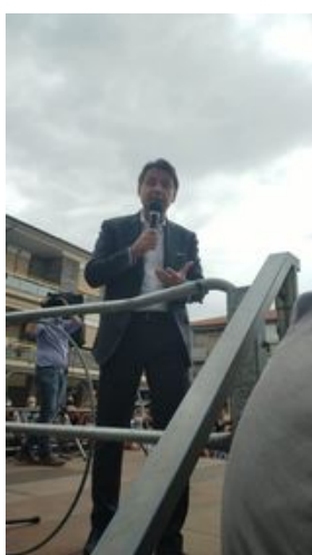
GIUSEPPE CONTE SUL PALCO

Dignità sociale, legalità e transizione ecologica: l'ex premier abbraccia il progetto sociale di Mario Cutrupi