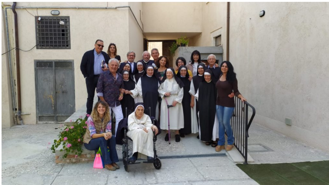
foto di gruppo con le Suore Celestine

L'AQUILA Si sono concluse il 29 agosto scorso le celebrazioni per i "Settecento anni con il Monastero di San Basilio", che continuano a riscuotere consensi e interesse contribuendo alla piccola-grande somma che è stata raccolta nel corso dell'evento a "costo zero" durato tutta la settimana celestiniana.