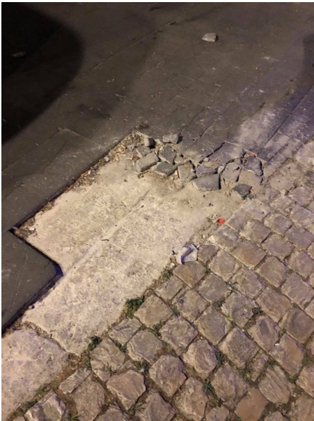
Piazza Dante Giulianova