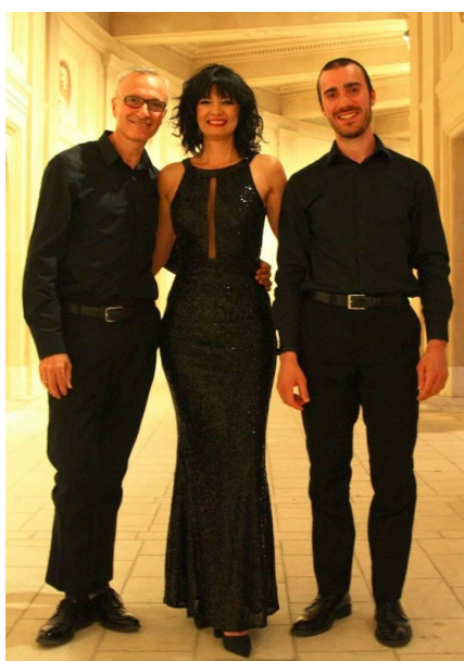
"IL PERDONO NUTRE IL MONDO"