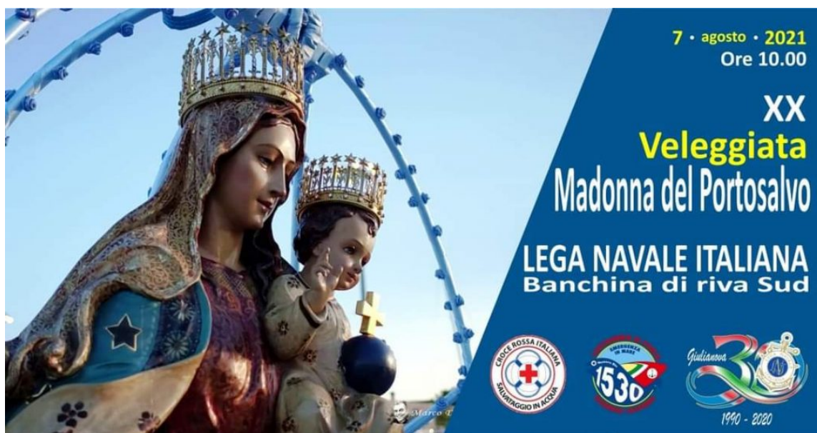
Madonna del Portosalvo