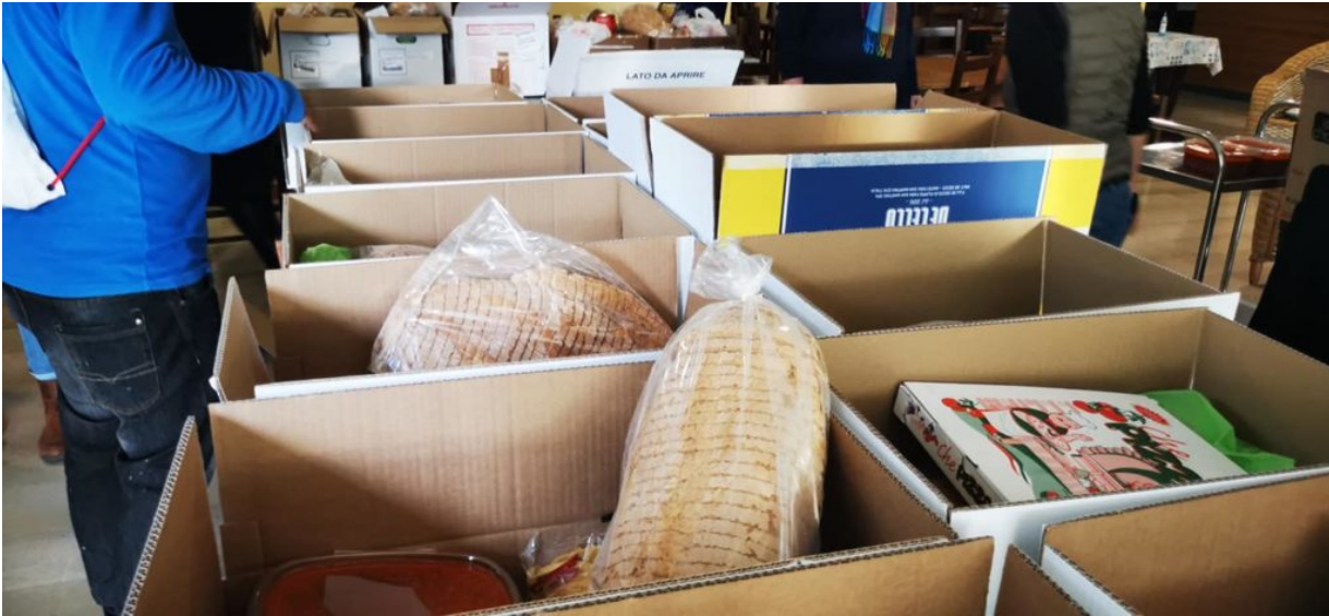
Befana solidale a Roseto

Continua l'impegno delle Guide del Borsacchio, insieme al Buon Vicinato, per assistere chi ha bisogno in questo periodo di difficoltà.