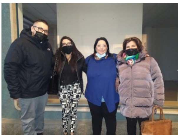
Partito Nazionale Rom e Sinti "Mistipè"

"Mistipè "nasce il 4 Dicembre 2020 con atto pubblico in Lanciano Abruzzo. Nasce dall'esigenza di combattere la discriminazione e l'odio razziale nei confronti dei Rom e Sinti in Italia , discriminazione e odio sempre più crescenti e accentuati soprattutto negli ultimi tempi .