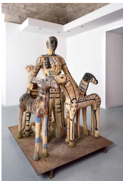
Mimmo Paladino, Assediato, 1999, terracotta dipinta e base in acciaio corten

Piazza Belvedere. Domenica 23 agosto , ore 21,30, ingresso gratuito