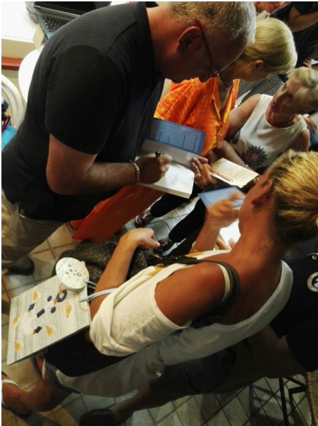
Gli autografi firmati dall'autore del libro