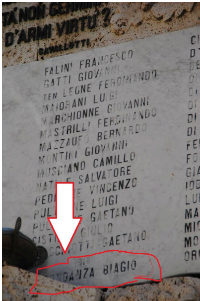
(C) Biagio Abbondanza - foto (R) Walter De Berardinis

In ricordo dei nostri caduti nella 1° guerra mondiale