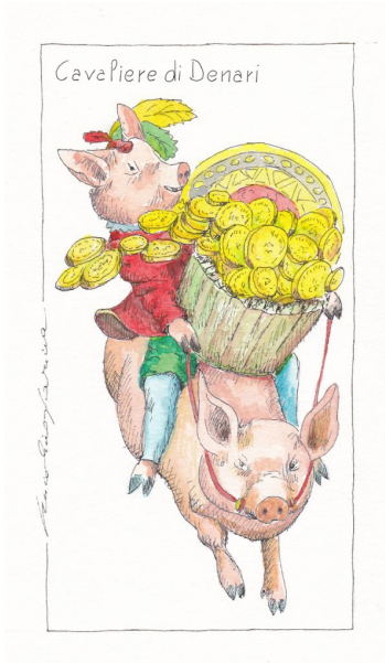
Le carte da gioco realizzate da Nicolino Farina