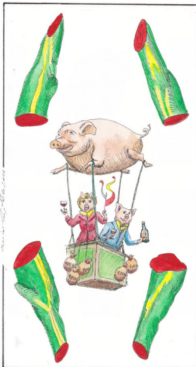
Le carte da gioco realizzate da Nicolino Farina