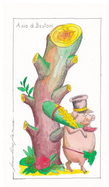
Carte da gioco di Nicolino Farina