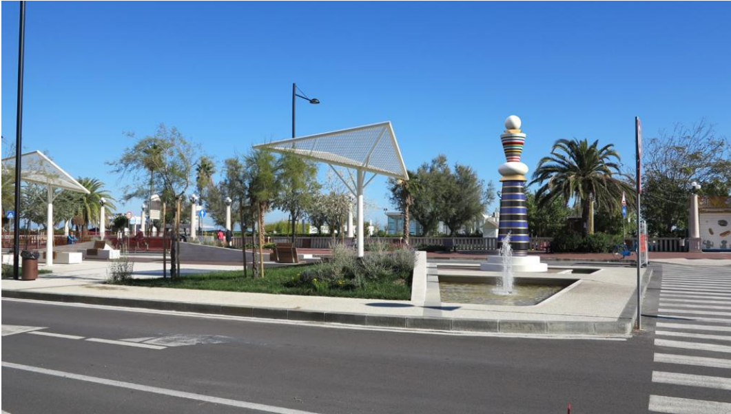
Piazza Dalmazia Summa