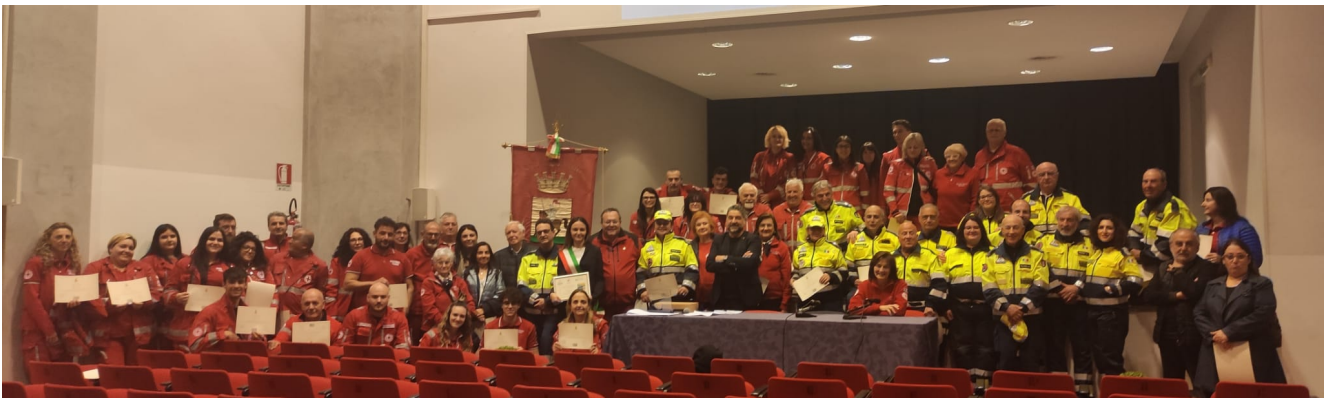
Croce Rossa e Protezione Civile