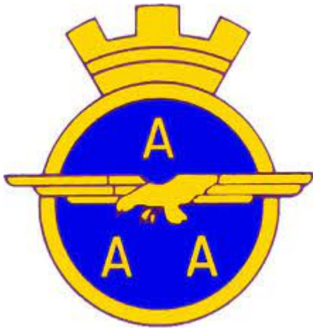
Logo Aeronautica associazione