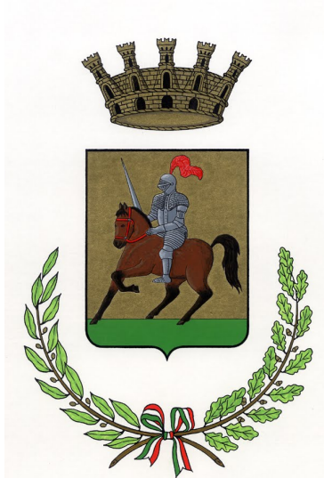
Città di Giulianova