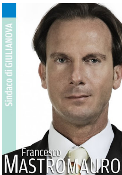
Sindaco di Giulianova, Avvocato Francesco Mastromauro

Giulianova. Ennesimo reato a Giulianova. Aggressione al centralinista del Comune. Il sindaco e la Giunta condannano la violenza e ribadiscono tolleranza zero.