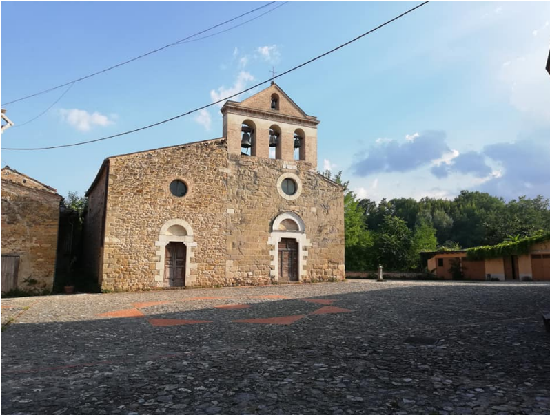
Castiglione della Valle Colledara