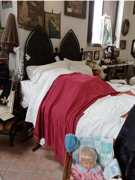
Museo di Montepagano