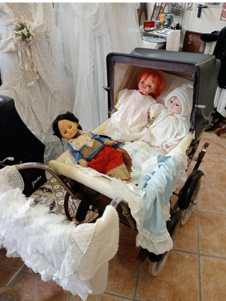
Museo di Montepagano