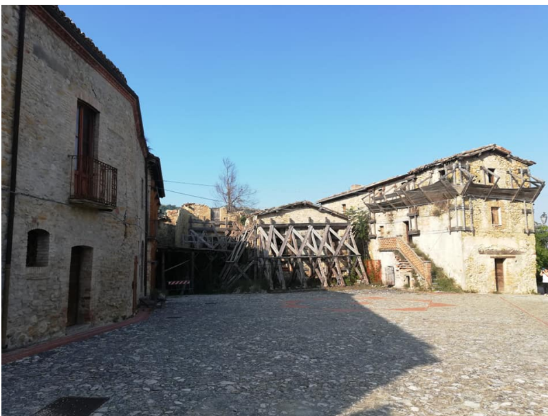
Castiglione della Valle Colledara