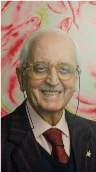
foto tratta dal libro “una vita per la bellezza” di Alfredo Paglione