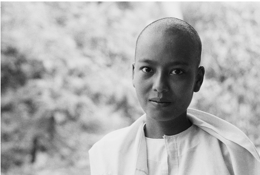
1. Raccolte Fotografiche ICCD, Fondo Sebastiana Papa Sebastiana Papa, Monastero buddista Thekkanemida, Yangon, Myanmar, 1999, b/n, negativo, FP0169_22 ( https://fotografia.cultura.gov.it/iccd/item/FP000169_22 )