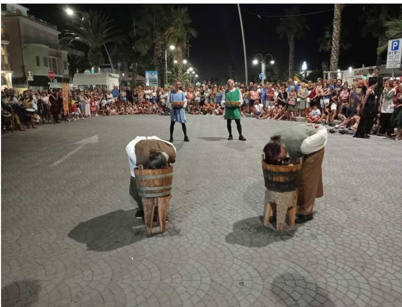
i primi giochi del 2023 finiti in parità