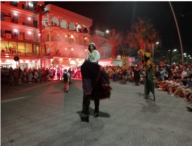
gli spettacoli dell'apertura del 2023