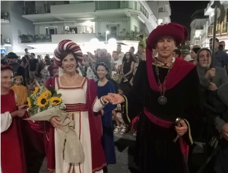
la Baronessa e il Barone di Tortoreto