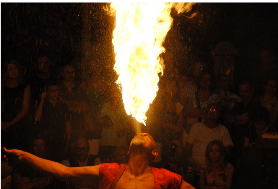
Spettacolo degli anni precedenti