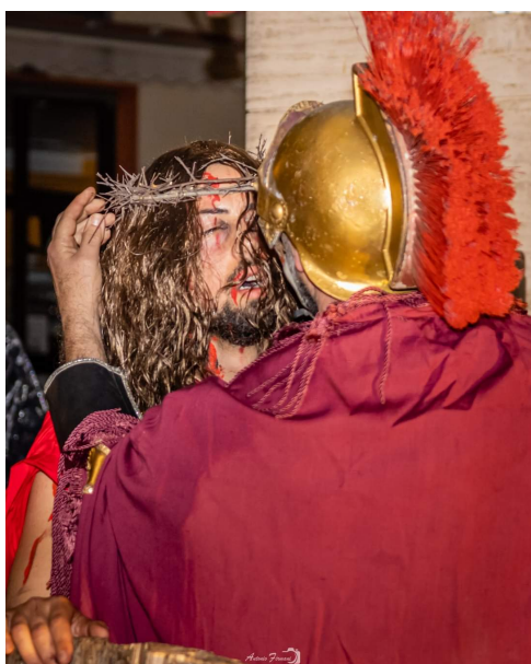
PASQUA GESU' CON LA CORONA DI SPINE