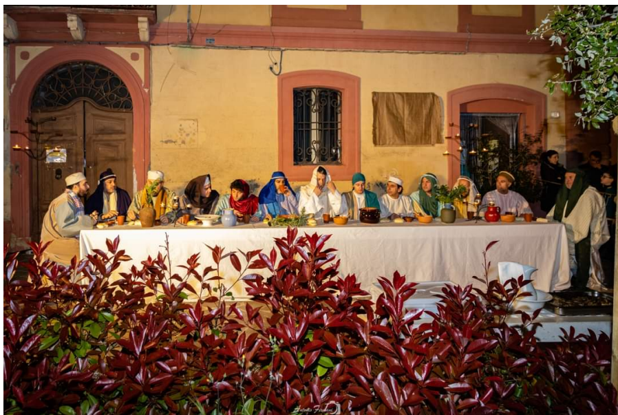
PASQUA ULTIMA CENA