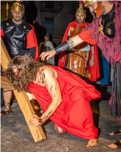
PASQUA GESU' CADE LA PRIMA VOLTA