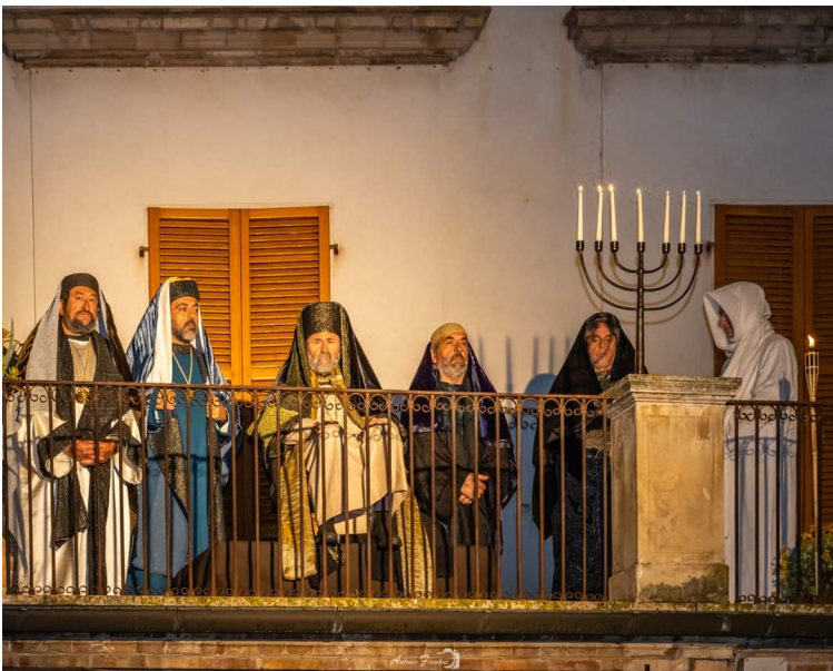
CAIFA NEL SINEDRIO PASQUA